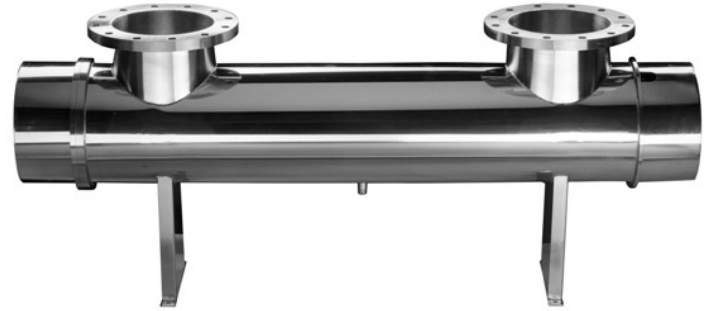
Ultraviyole Dezenfeksiyon Sistemleri